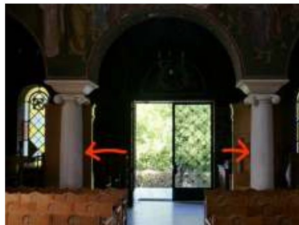
Οι δύο κολόνες που και εκεί έγραψαν παρόμοιες φράσεις.