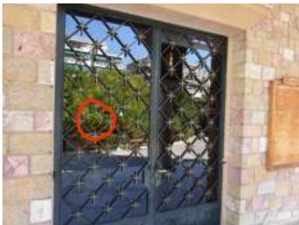
Το σημείο της πόρτας από όπου εισήλθε η πέτρα στο εξωτερικό του ναού.

Ημ/νία συμβάντος: 16/17 Ιουνίου 2015 (βλ. ανωτέρω ενότητα II.B.2)