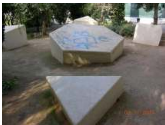
30 Οκτωβρίου 2014, Μνημείο Ολοκαυτώματος, Αθήνα