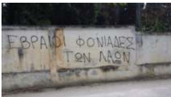
6-7 Ιουνίου 2015, Εβραϊκό Νεκροταφείο, Καβάλα