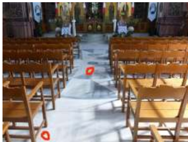
Τα σημεία που βρέθηκαν οι πέτρες.