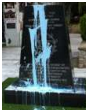
21 Ιουνίου 2015, Μνημείο Ολοκαυτώματος, Καβάλα