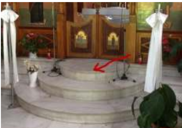
Τα σκαλιά του Ιερού όπου έγραψαν με μαρκαδόρο την φράση «ο Αλλάχ είναι μεγάλος» στην αραβική.