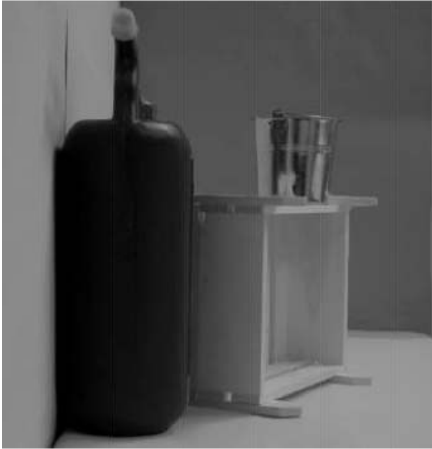
Τρίτη φωτογραφία : Πλάγια όψη