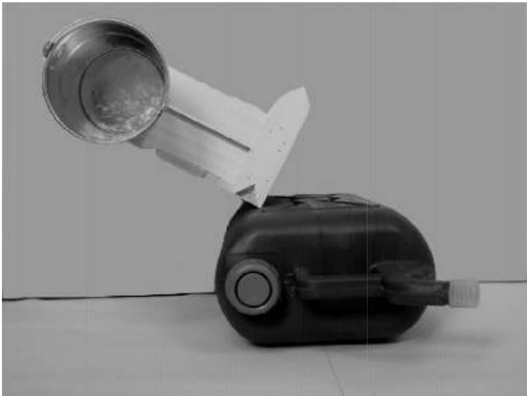
Τέταρτη φωτογραφία : Κάτοψη