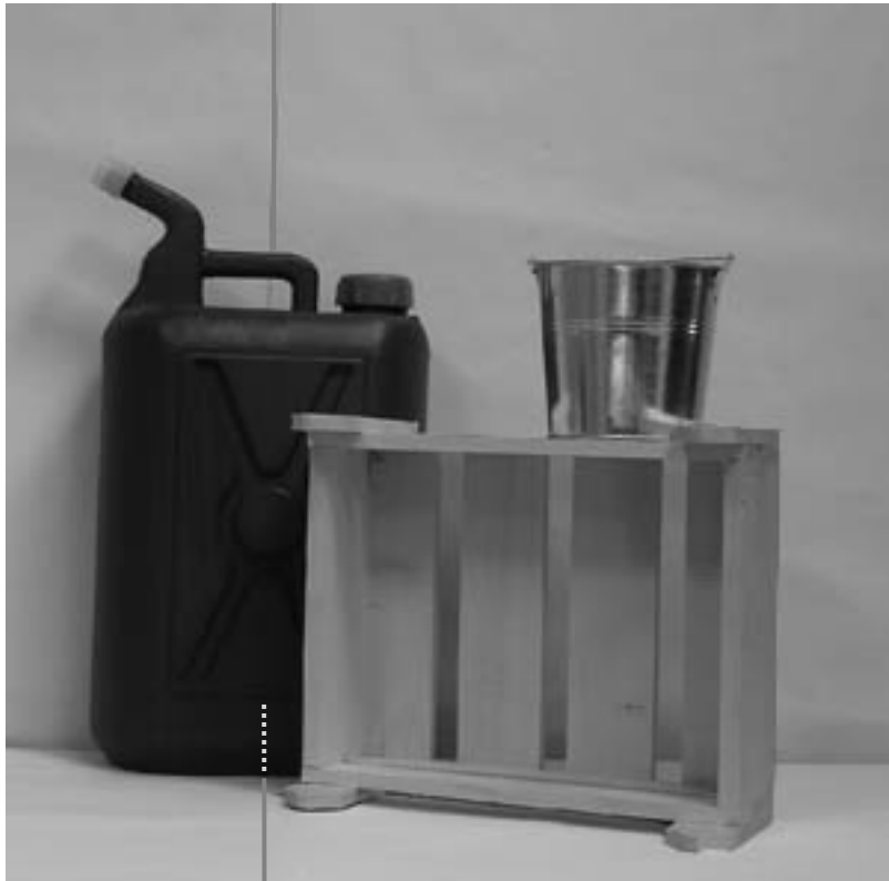
Πρώτη φωτογραφία : Μπροστινή όψη